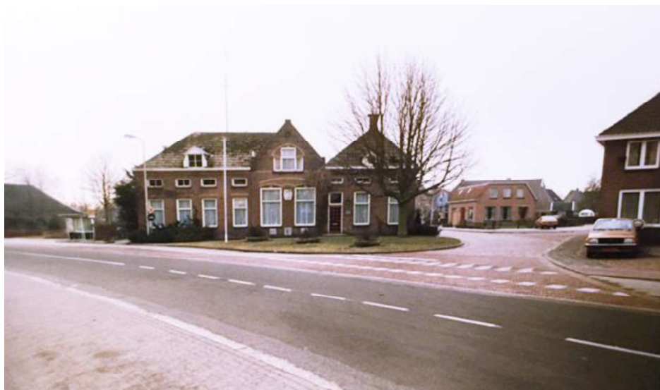
De driesprong omstreeks 1980, waar het dramatisch ongeluk plaats vond