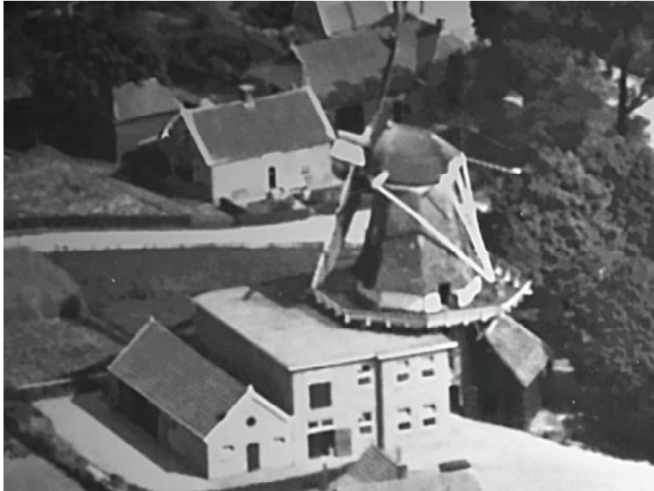
De korenmolen en het pakhuis anno 1932. Met links de kunstmestloods en paardenstal en het pakhuis zelf, met ramen en toegang tot de graanzolder zoals de het in 1945 nog was